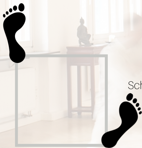
Schrittstellung mit linkem Fuß vorne